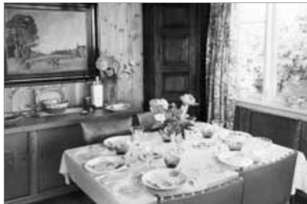
Her fra en rekemiddag på Grubbehaugen. De svenske krystallglassene og fiskeserviset fra Figgjo er nå borte.